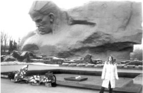
Учащиеся школы №2 в Брестской крепости